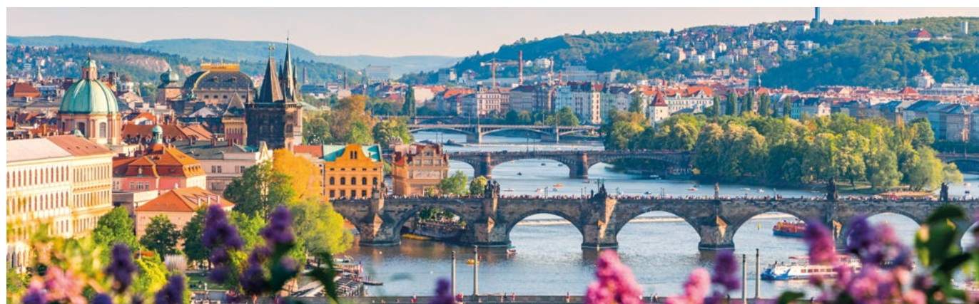
Dall'alto: vista del Ponte Carlo a Praga; piazza Maggiore a Bratislava.