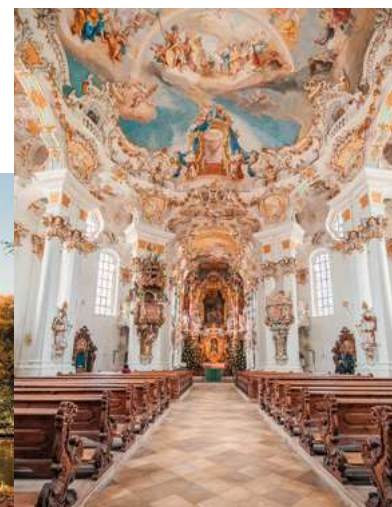
Sopra: interno della chiesa di Wieskirche.