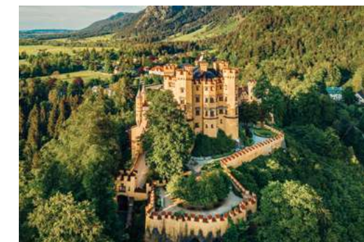
Sotto: castello di Hohenschwangau.

Tour in pullman: al mattino iniziamo il nostro viaggio di rientro in Italia. Lungo il percorso sono previste alcune soste per il ristoro e il pranzo libero. L'arrivo è previsto in tarda serata. Tour in aereo: in base all'orario del volo di ritorno, ci sarà del tempo a disposizione per shopping o visite individuali. L'assistente è a disposizione per organizzare il trasferimento all'aeroporto in tempo utile per la partenza.