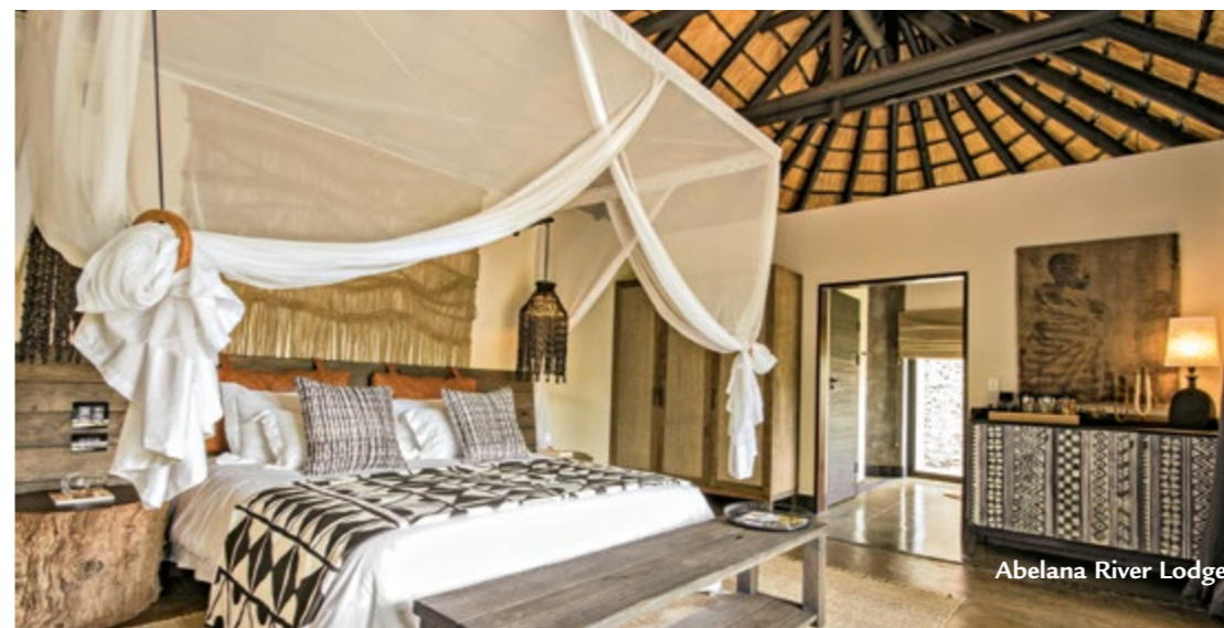
Abelana River Lodge

Questo è un viaggio di scoperta. Il Sudafrica è un paese la cui estensione è quasi 3 volte l'Italia. Le distanze da percorrere sono talvolta lunghe e il ritmo del viaggio per alcuni potrà sembrare incalzante. Questo è inevitabile se si desidera ammirare quanto di più significativo il Paese ha da offrire. Se mal tollerate trasferimenti lunghi, Vi invitiamo a valutare soluzioni più rilassanti e/o una durata del viaggio superiore con spostamenti interni in aereo come nel caso del nostro tour Diamond South Africa.