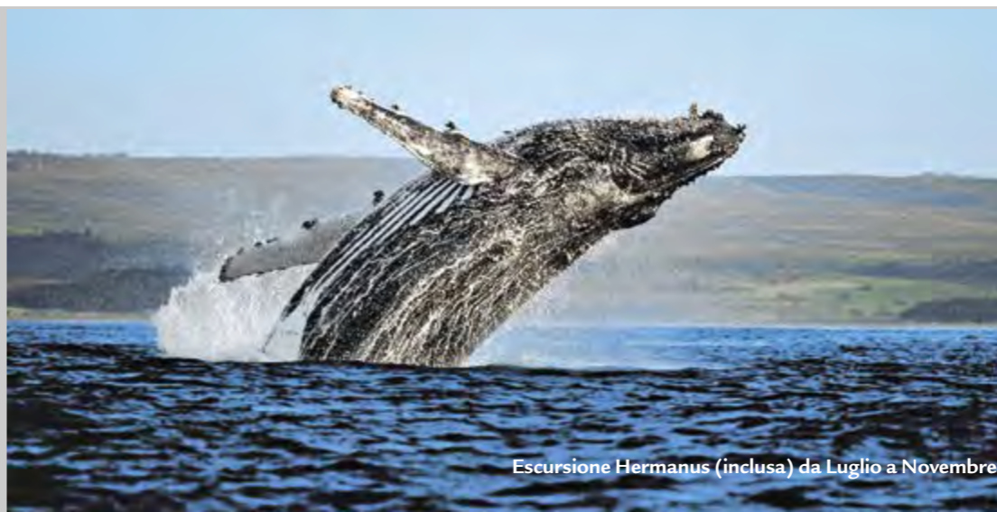
Escursione Hermanus (inclusa) da Luglio a Novembre

Questo è un viaggio di scoperta. Il Sudafrica è un paese la cui estensione è quasi 3 volte l'Italia. Le distanze da percorrere sono talvolta lunghe e il ritmo del viaggio per alcuni potrà sembrare incalzante. Questo è inevitabile se si desidera ammirare quanto di più significativo il Paese ha da offrire. Se mal tollerate trasferimenti lunghi, Vi invitiamo a valutare soluzioni più rilassanti e/o una durata del viaggio superiore.