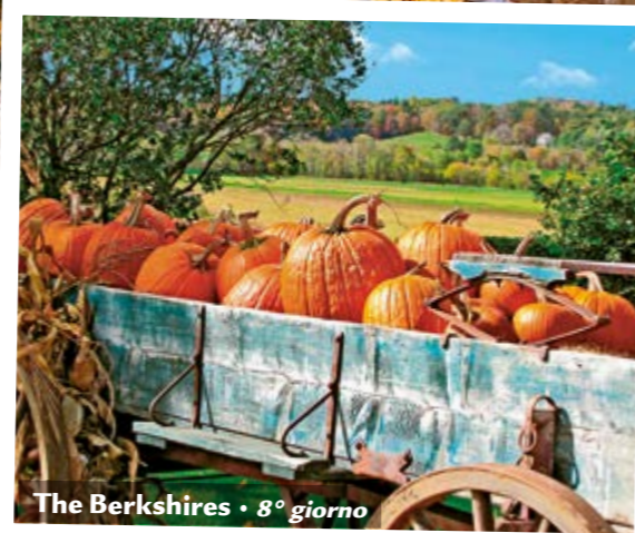
The Berkshires • 8° giorno