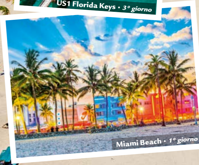
Miami Beach • 1° giorno