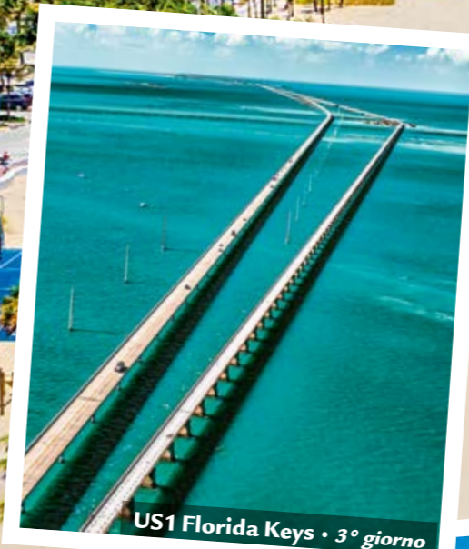
US1 Florida Keys • 3° giorno